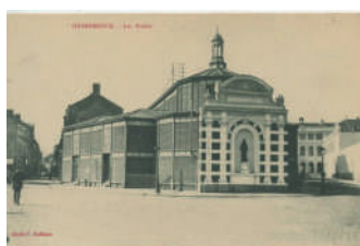
Les anciennes halles d'Hazebrouck

Située en cœur de ville, à proximité de tous services et commerces et de la gare d'Hazebrouck, la résidence Les Halles bénéficie d'un emplacement idéal. Baptisée en référence aux anciennes halles hazebroucoises qui occupaient la même parcelle autrefois, la résidence compte 37 logements collectifs locatifs allant du type 2 au type 5. La variété des typologies proposées permet de répondre à une demande plurielle tout en favorisant la mixité sociale et intergénérationnelle. Livrés entre août et octobre 2021 et construits dans un style architectural moderne et épuré, les logements sont adaptés aux seniors et personnes à mobilité réduite.